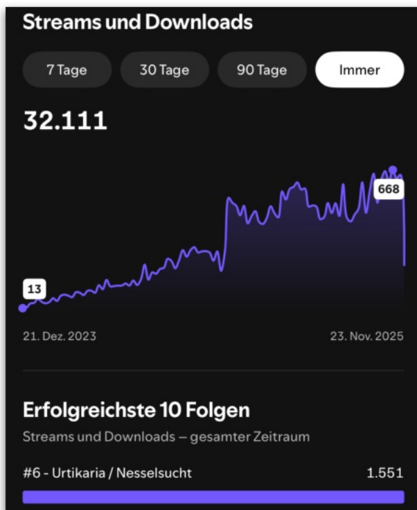
Die Hörerstatistik zeigt ein kontinuierliches Wachstum.

Zur Bewerbung von „Hautgeschichten“ stellen wir interessierten Kolleg:innen außerdem Flyer für Patient:innen bereit.